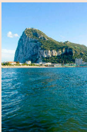
Gibraltar es la puerta de entrada del 30% del tabaco ilegal.

Un 10,3% de cigarrillos ilícitos supone 930 millones al año en impuestos no recaudados